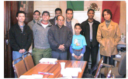
Un aprendizaje con plan humano