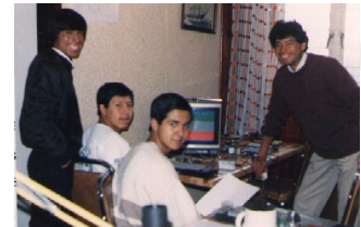
Un aprendizaje con plan humano